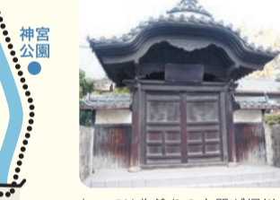
かつては朱塗りの山門が堀川に面して建てられており、赤門寺とも呼ばれていた。