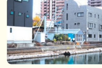
夜にはライトアップした姿が見られる。

昔は製材業者が立ち並び、水面にびっしりと筏がたぎ止められていた堀川岸。現在、完全な姿で残るクレーンはこの1基のみに。