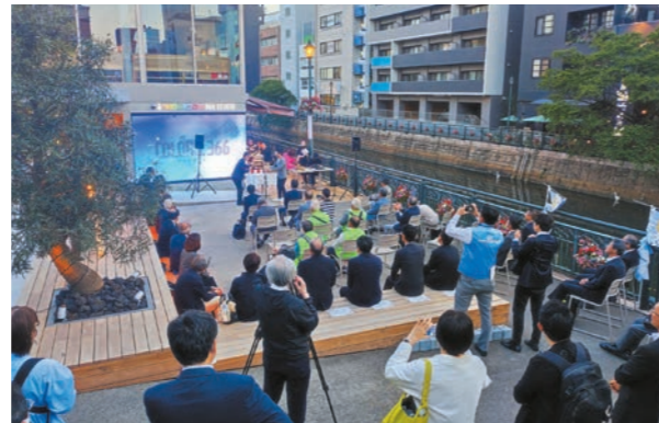
第3回堀川検定アンバサダー任命式の様子