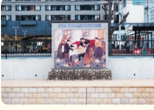
現在は記念碑を見ることができる。

名古屋大学医学部の前身である愛知医学校と愛知病院があった場所。元御船奉行の千賀氏の屋敷跡地に建てられ、明治10年から大正3年までこの地で西洋医療とその教育が行われた。