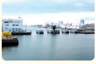
水門の高さは周辺の防潮壁と同じ高さ(名古屋港基準面+6m)

伊勢湾台風の教訓を生かし、昭和39年に完成。台風や大潮などで高潮の可能性のある時は水門を閉め、高潮の侵入を防ぐことで、名古屋のまちを守っている。