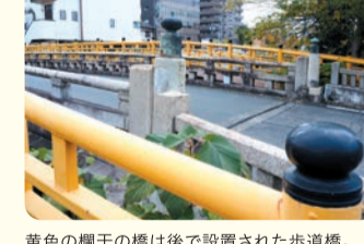
黄色の欄干の橋は後で設置された歩道橋。