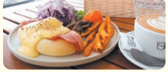
エッグベネディクトプレートとカフェラテ