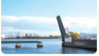
鉄道廃線後、桁を跳ね上げた状態で保存されている。

紡績業の発展に伴う臨港鉄道延伸のため、昭和2年に堀川と中川運河をつなぐ運河に架設された。日本に残る最古の跳上橋。