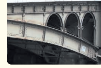
戦前に作られた飾り板が今も使われている。