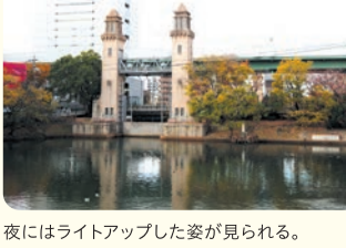
夜にはライトアップした姿が見られる。

昔は製材業者が立ち並び、水面にびっしりと筏がたぎ止められていた堀川岸。現在、完全な姿で残るクレーンはこの1基のみに。