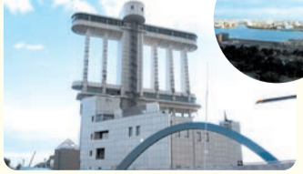
展望室からは堀川も見える

外観は白い帆船をイメージしたデザイン。最上階の7階は名古屋港が一望できる「展望室」、3・4階には船や海のことを学べる「名古屋海洋博物館」がある。