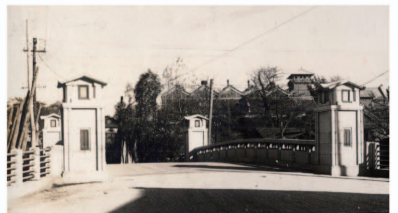
竣工後の古渡橋