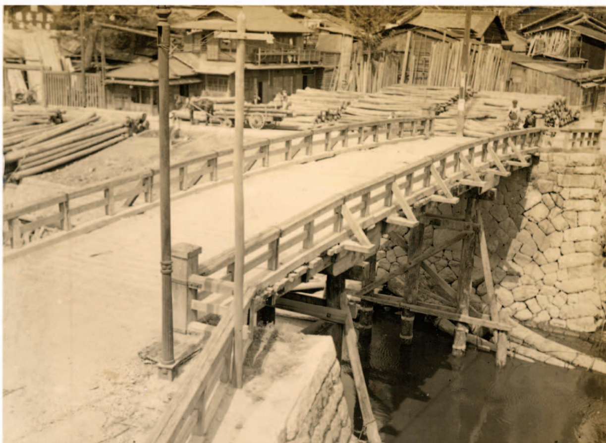
昭和初期の古渡橋(名古屋都市センター蔵)