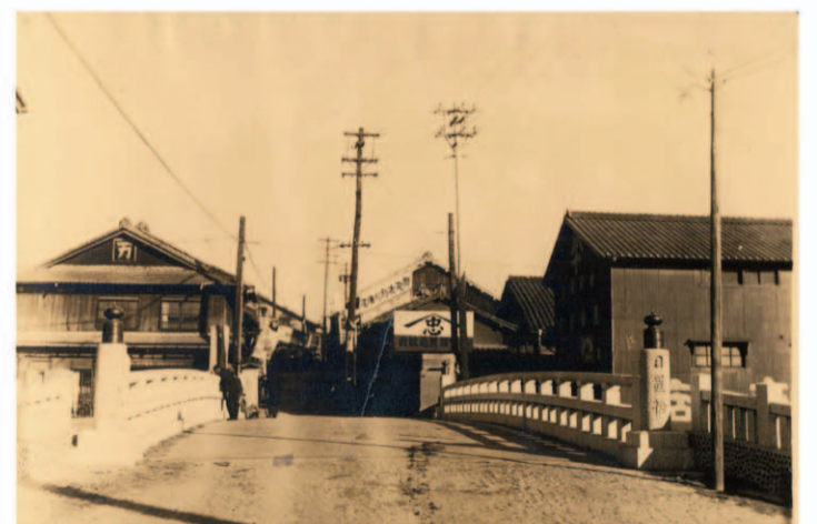
昭和14年頃の日置橋