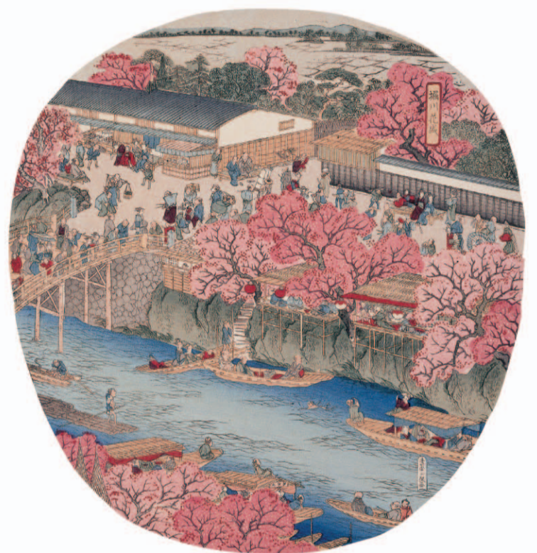
堀川花盛（名古屋名所団扇絵集）