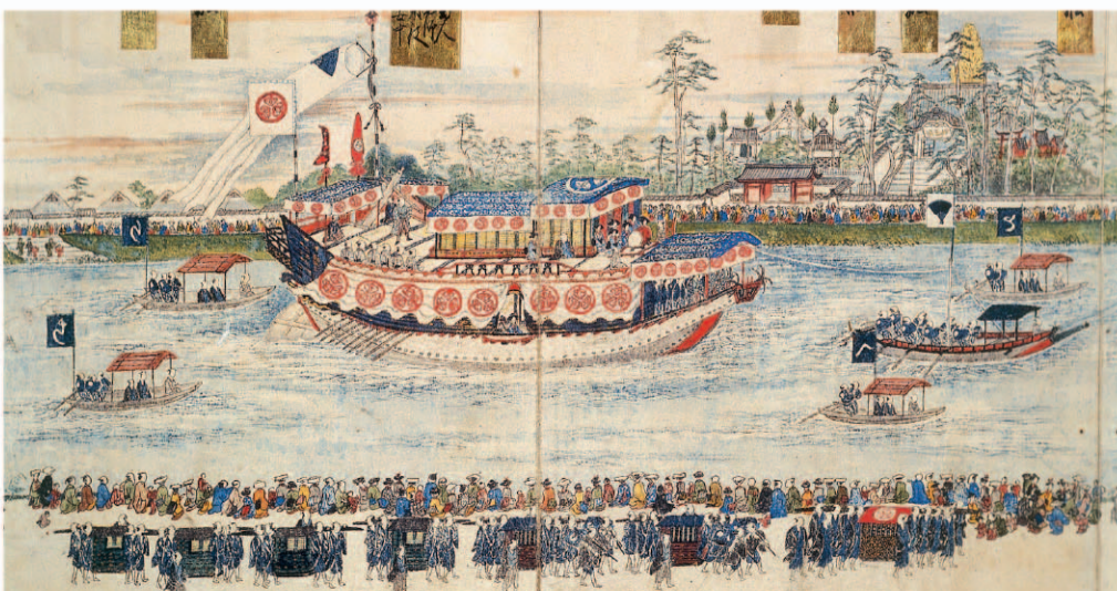
御船御行列之図（名古屋市博物館蔵）