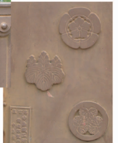
信長・秀吉・家康の家紋と 製作者の銘板