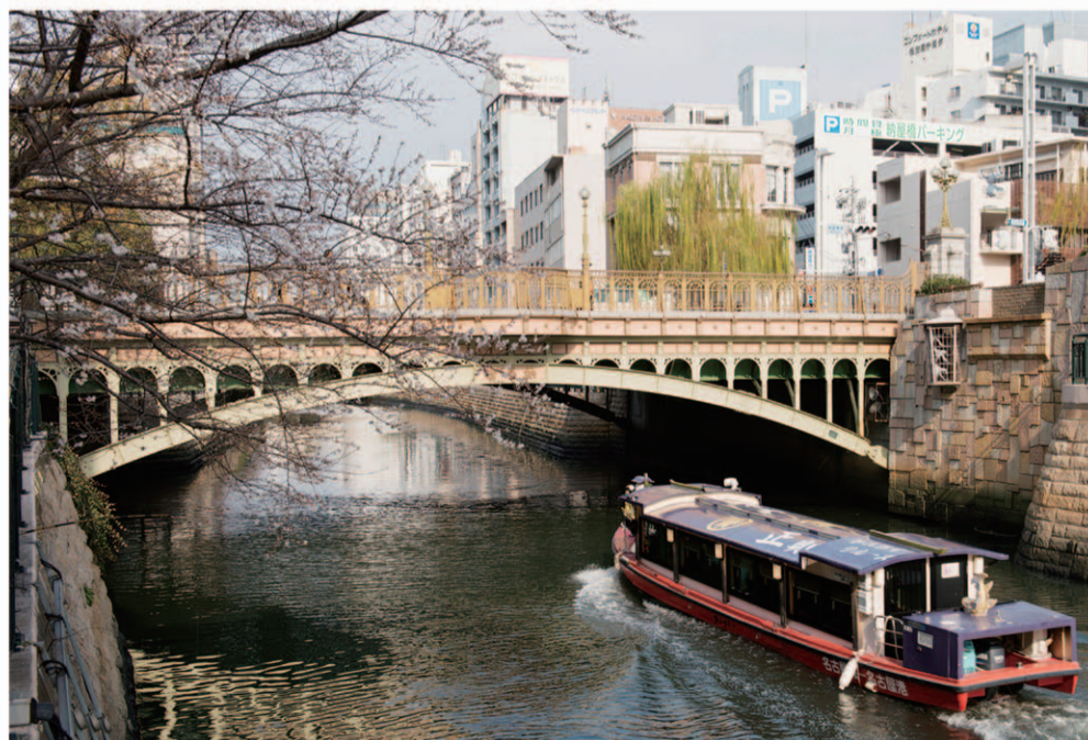
現在の納屋橋 大正時代の面影を伝える工夫がされている

広小路が通る納屋橋は堀川で一番賑やかな橋である。だが江戸時代の納屋橋は碁盤割南端に架かり、賑やかな場所ではなかった。明治19年に名古屋駅が開業し、路面電車が開通して名古屋への玄関口となった。交通ネックの解消に向け木造納屋橋の改築が決まり、鉄石混用アーチ橋に架け替えとなった。明治45年2月着工、施工は西区の栗田組が請け負った。アーチ橋は荷重が両端の橋台にかかるので念入りに施工した。打った杭数640本、打ち込む分銅の重量450kgの杭打機2台を用いた。割栗石を敷いた上に60cmのコンクリートを打って基礎とし、その上に煉瓦や花崗岩を積み上げ橋台を築く。翌大正2年に車道や軌道も竣工し、3月には親柱や手摺の取付が始まった。石製品は岡崎産だ。欄干の笠木部分と照明器具の一部は青銅、手すり子（欄干の笠木と橋面の間の柵）は鋳鉄製で今の金山駅南にあった中島鉄工所が製造している。大正2年4月15日大工事は竣工した。今では「レトロな橋」と呼ぶが、当時の新聞は「ハイカラな橋」と表現している。名古屋を代表する納屋橋も老朽化と拡幅の必要から、昭和56年に幅30mにして架け替えられた。人々に親しまれ時代の文化を伝える貴重な資産でもあるので、欄干は大正2年のものを補修して使い、桁橋だが装飾としてアーチを付けかつての面影を今に伝えている。