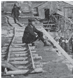
現場への運搬はトロッコ