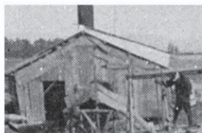
湧水が多くポンプを設置