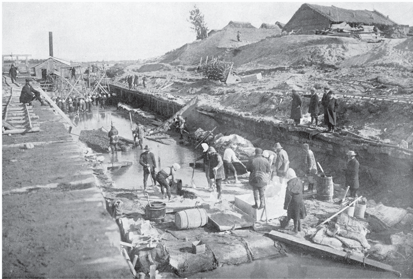
矢田川の中央で仕切り、最初に守山区側の工事を行った。