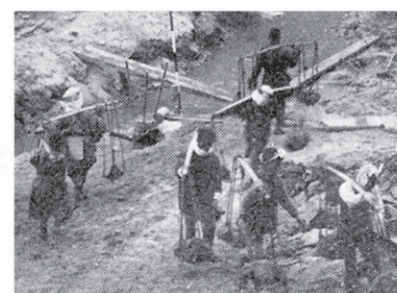
資材は天秤棒で運搬