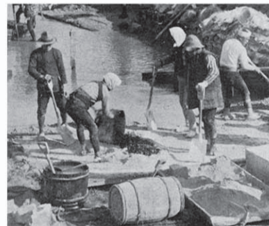
セメントは樽で輸送