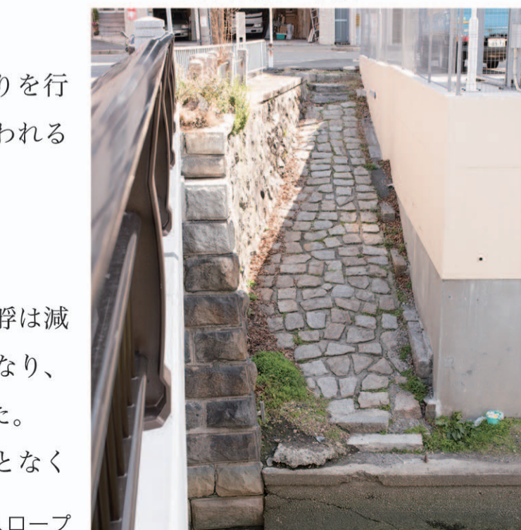
中橋南東 スロープ