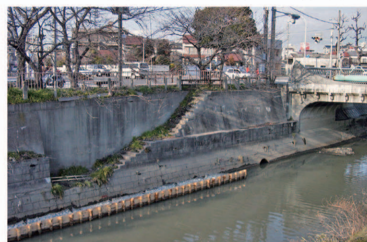
金城橋北西の物揚場 護岸に並行