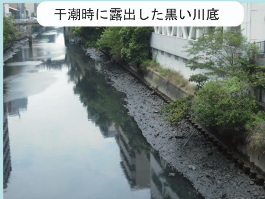
干潮時に露出した黒い川底

川の底が黒いのは、一つには下図のように微生物の働きにより、水中に含まれる鉄分が化学反応を起こして黒くなるためとされています。