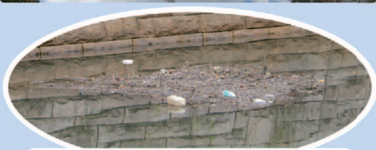
浮遊ゴミは、枯枝などと絡まり塊となって浮遊を続けます。