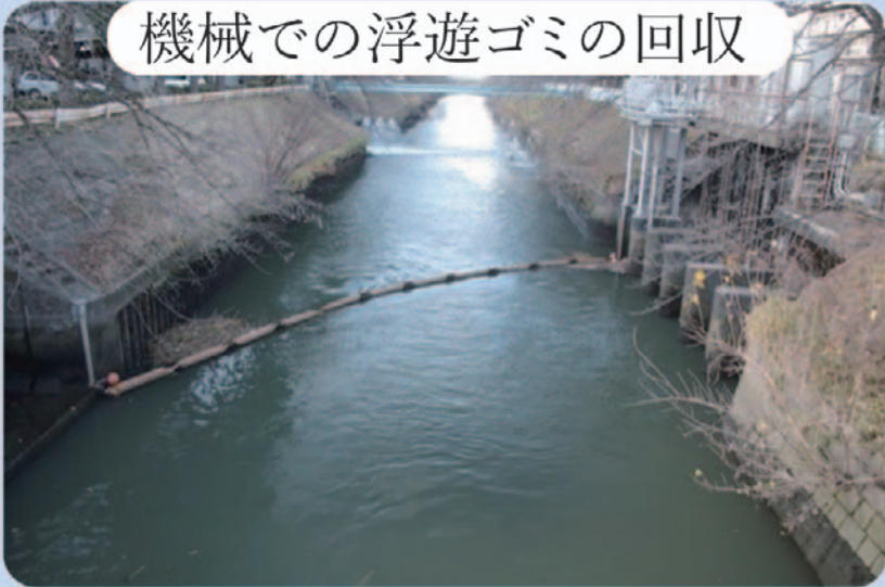
機械での浮遊ゴミの回収