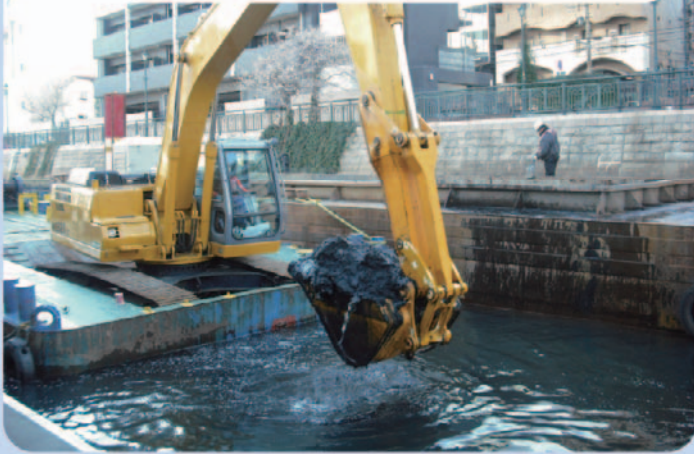
堆積したヘドロの除去