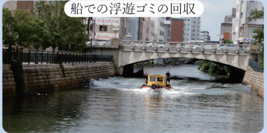
船での浮遊ゴミの回収