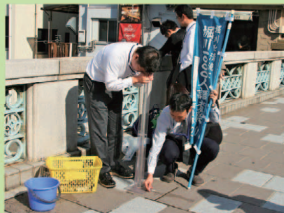
水質等調査・研究