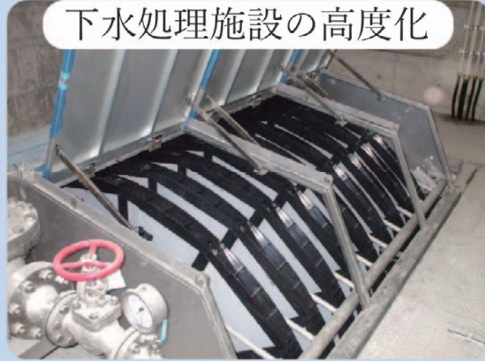
下水処理施設の高度化