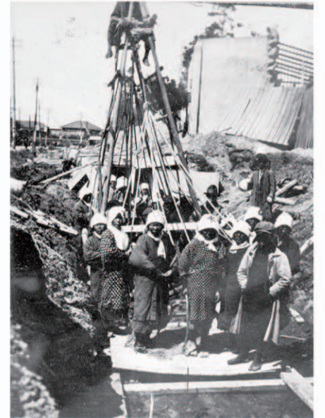
よいとまけで杭打

運河の掘削と沿線の倉庫・工場用地の造成が進むなか、昭和4年5月には北端の広い空地に線路が敷かれ名古屋新貨物駅(後の笹島貨物駅、現在のささしまライブ24)ができています。また、地域の排水をよくするため、運河開削に歩調を合わせて西部下水道幹線が造