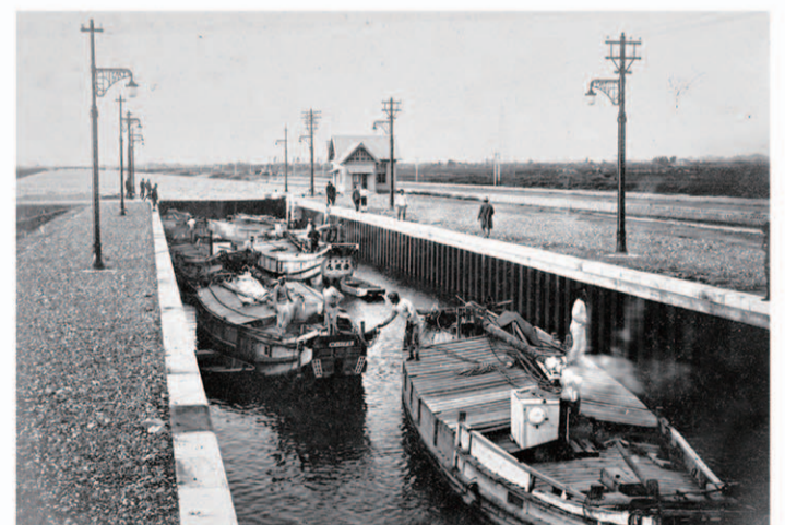
完成した中川口閘門

沿線も急速に発展していった。8年には両岸に市バスが通るようになり、10年には市内から30の鉄工業者が移転して操業を始めている。11年になると新貨物駅で船車連絡作業が開始され水陸の輸送が円滑になり、運河沿いに工場が87、倉庫などが81設けられ、さらに笹島貨物駅のある船溜北岸には東神倉庫(株)(現:三井倉庫(株))と東陽倉庫(株)の3階建ての倉庫が建てられている。