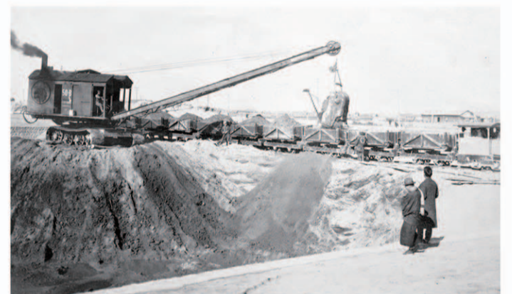
重機で掘削、トロッコで運搬

関係住民の犠牲と工事関係者の努力により、昭和5年10月10日に通水が行われ、25日から本線と北支線の利用ができるようになった。堀川につながる東支線は、翌6年7月25日に松重閘門から東海道線までの区間が、さらに7年12月20日に東海道線の下も通航できるようになり、運河全線が完成した。