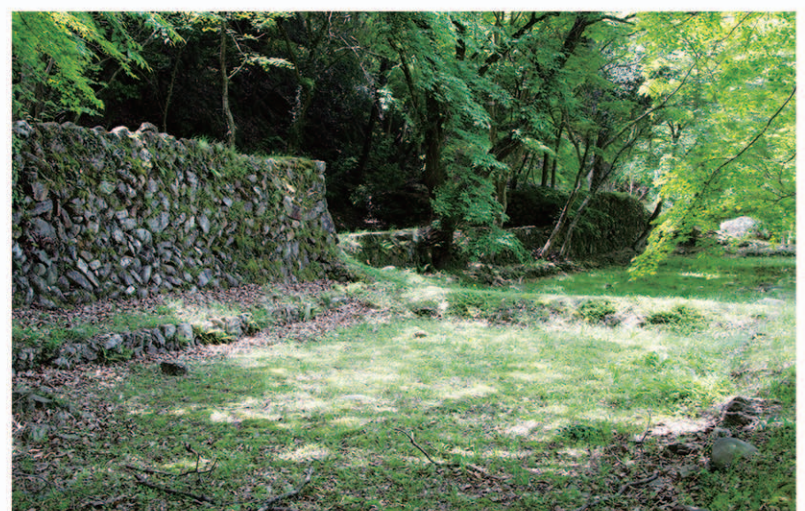
今も残る氷場の跡 可児川下流自然公園内

明治40年頃まで活発な輸送が行われていたが、鉄道の整備により徐々に利用が減り、大正13年に営業を止めている。