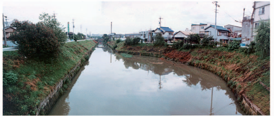
黒川の船着場 昭和58年頃(現:北清水親水広場)

愛船(株)による輸送は、23年9月から翌年6月までの10か月間で、次の実績をあげている。