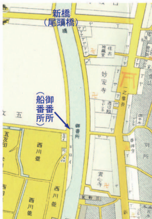
下流(尾頭)の船番所 『熱田神領字入図』