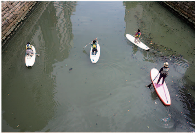
2017年7月1日 SUPで堀川に入りました。 ボードの周りに底から上がってくるヘドロと泡が見えます。ボードには臭いが付きました