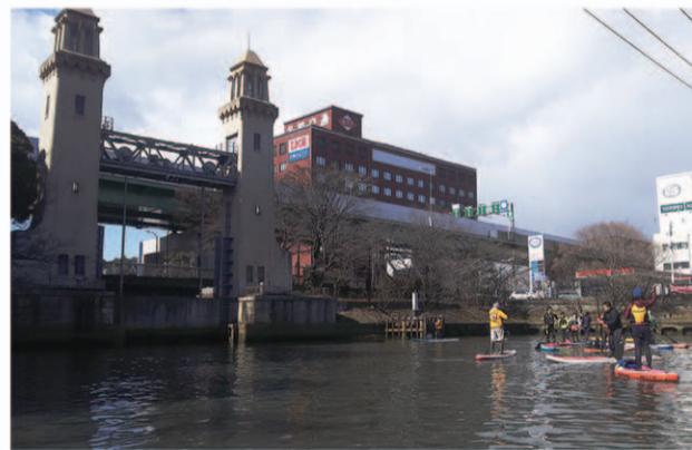
松重閘門近くで 東京、横浜、大阪のパドリストらと名城公園から宮の渡しまで