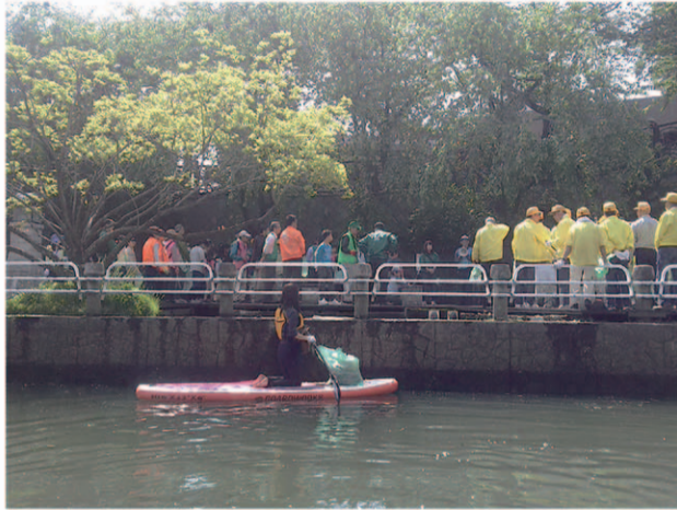
堀川一斉清掃に参加 垂直に立つ護岸の雑草をむしり、水面のゴミを集めました

SUP (Standup Paddle Board) は、通常のサーフボードより幅広の、多くの場合、空気を入れて膨らませたボードに乗り、Paddleで漕いで進みます。持ち運びしやすいことから、遠くの海、川、湖などでも楽しむことができます。マリナーレジャーの一種とも言えますが、水面に人が立っているという非日常感は橋や岸の上から見る人たちを驚かせますし、歩いて、また船などで行けないような水面を、まるで“まち歩き”するかのように楽しむことができます。