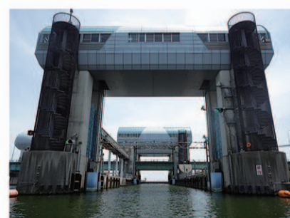
長良川河口堰も通過 できます

大阪では日本シティサップ 協会が船外機を付けた4人 乗りのビッグサップで観光 ツアーを展開しています