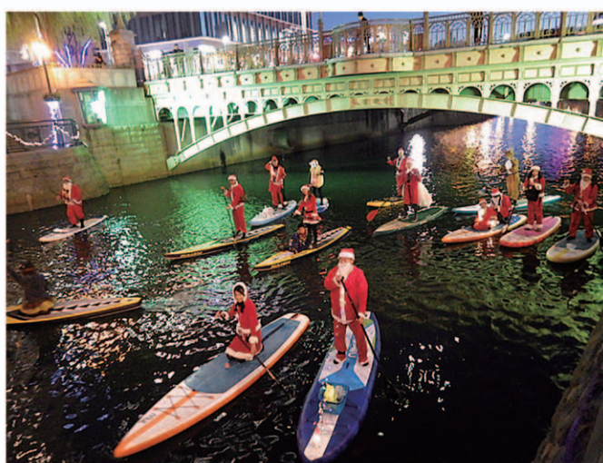
2018年12月24日 クリスマスイブは 納屋橋の魅力を最大限に！