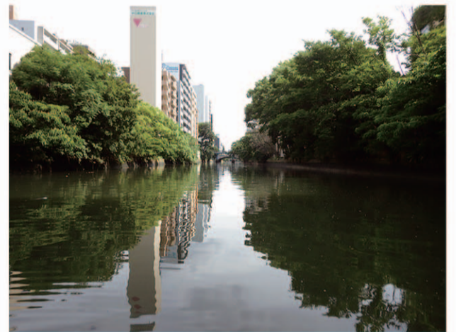
SUPからの視線はこんなにも低いものです