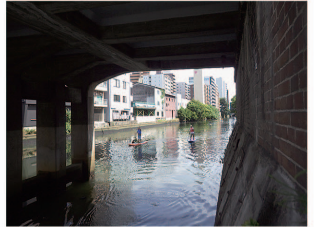
船着場から、趣きある五条橋の真下をくぐって 下流へと向かいます