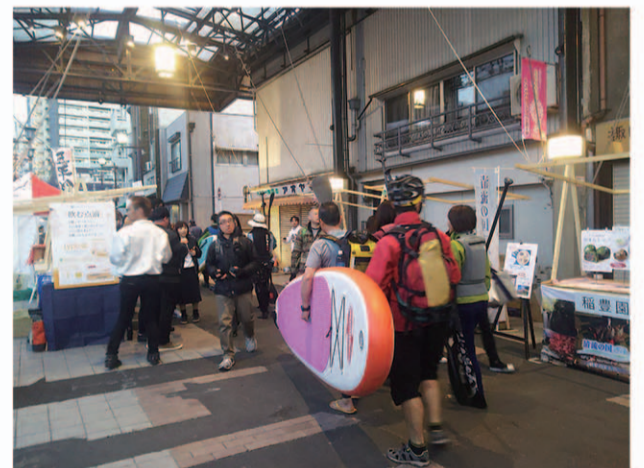
五条橋の船着場から陸に上がって円頓寺商店街 ビーチサイドの感覚です