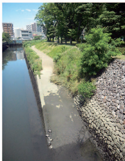
こんなスロープがあったとは?! SUPに乗ら なければ目にも留めなかったかもしれません