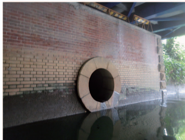
水辺の景色 船からも見ることができますが SUPだと立ち止まって思い通りに撮影ができます