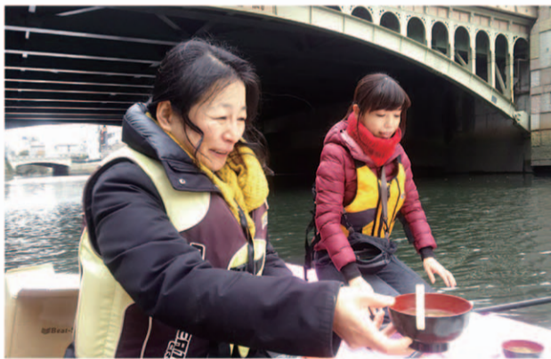
2018年1月2日 正月は堀川の水上で お雑煮をいただきました