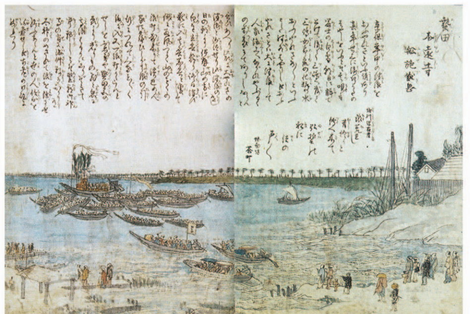
熱田本遠寺船施餓鬼(尾張年中行事絵抄)

享保7年(1722)8月の台風によって、熱田で大勢の死者を出した。これを契機に熱田の本遠寺が船を浮かべての供養を始めた。本堂での説法後、僧侶や信者多数が船に乗り込み、お題目を唱えて供養した。後には水死者の供養となり、日本三大川施餓鬼と言われるほど盛大で、今も行われている。