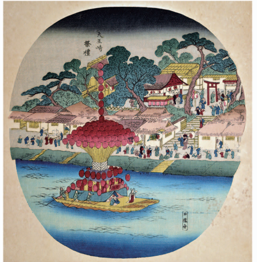
天王崎祭礼(尾張名所団扇絵)

神輿渡御では船に神輿 みこし を載せて堀川をのぼり、堀留(現:朝日橋)の御旅所に行って陸路で還御する。夕闇が迫ると堀川に浮かぶ巻藁船の提灯に火が入り、幽玄な明かりがゆらゆらと川面に映る。もっとも、船上で舞を奉納している巫女は、実は男性。おもしろおかしい所作で、見物客を笑わせたという。神事そのものがもっている興行的な性格もあったようだ。神社で一年間保管した御葎を堀川に流す御葎流しも行われ、御葎を得ようと人々が争い熱狂した祭である。