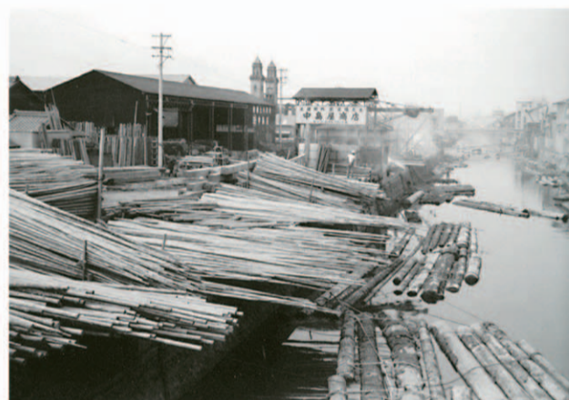
山王橋下流 昭和50年