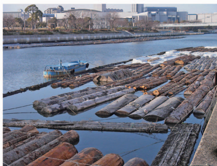
白鳥の係留筏 昭和60年頃