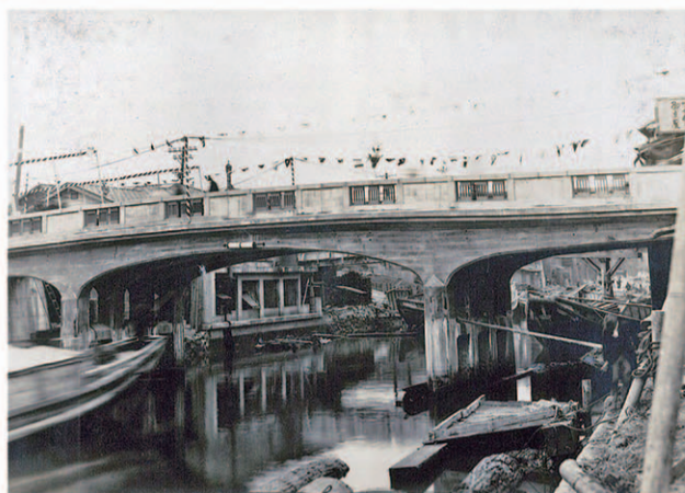
洲崎橋 (都市センター蔵)