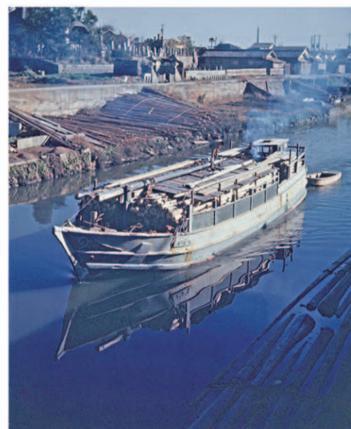
GHQ職員モージャー氏撮影の舟 昭和21年頃 (国会図書館蔵)