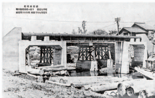
尾頭橋付近 水面を覆う筏 昭和初期