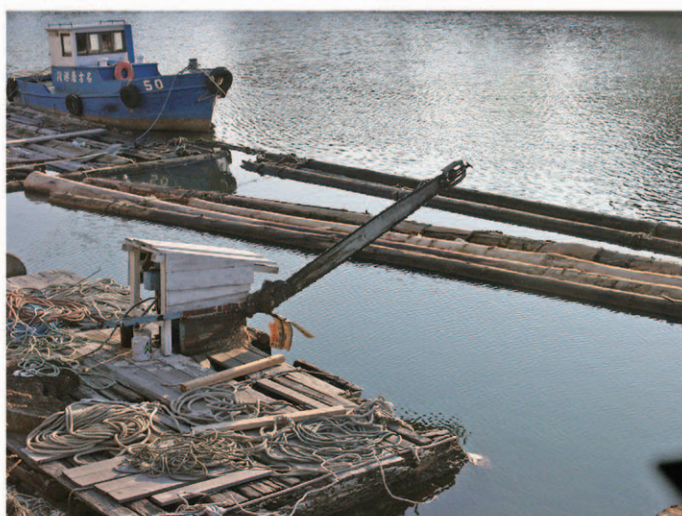
水上で丸太を切断するチェーンソー 白鳥 昭和60年頃