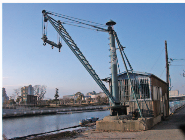
原木の陸上げに活躍するクレーン 白鳥 昭和60年頃