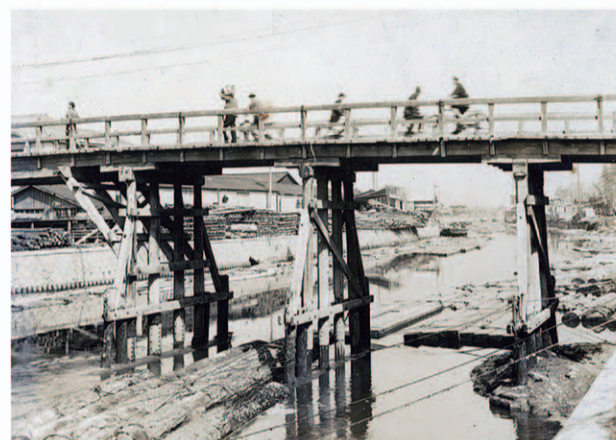
瓶屋橋 昭和11年