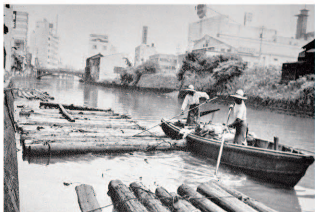
納屋橋下流で水面清掃 昭和40年頃 (市政資料館蔵)