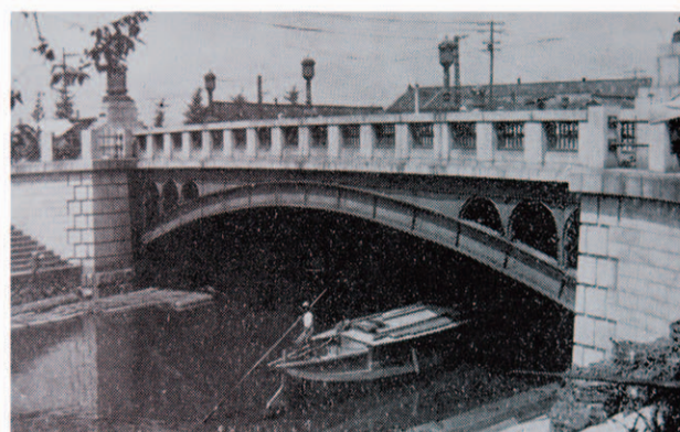
岩井橋 近代的な鉄橋 たもとの物揚場も立派