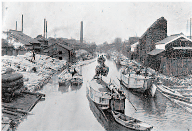
混み合う堀川を行く舳 明治43年 (愛知県写真帖)