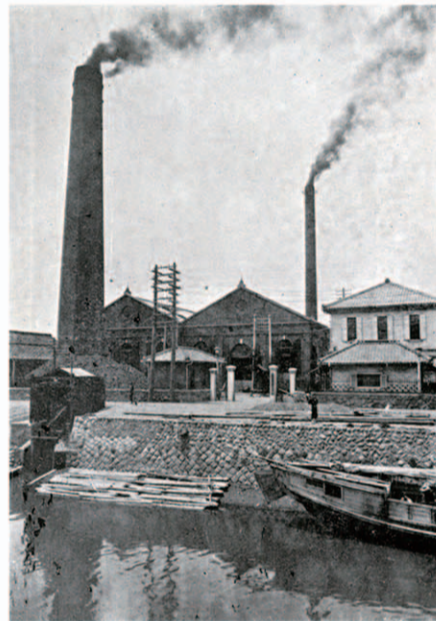
水主町の名古屋電灯 燃料の石炭は堀川で 明治43年 (愛知県写真帖)