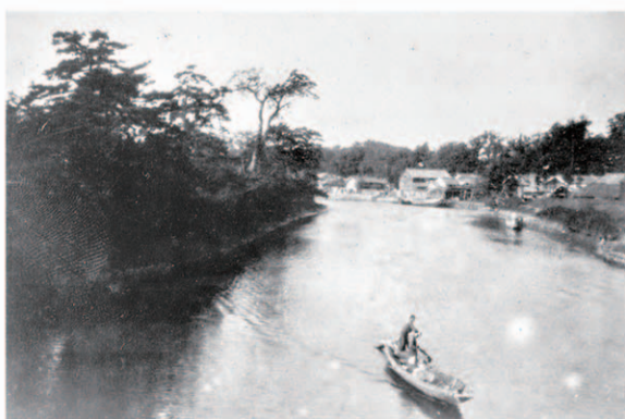
熱田 明治末～大正