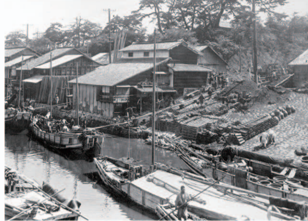
景雲橋上流 瀬戸電堀川駅の 鉄道輸送と連結