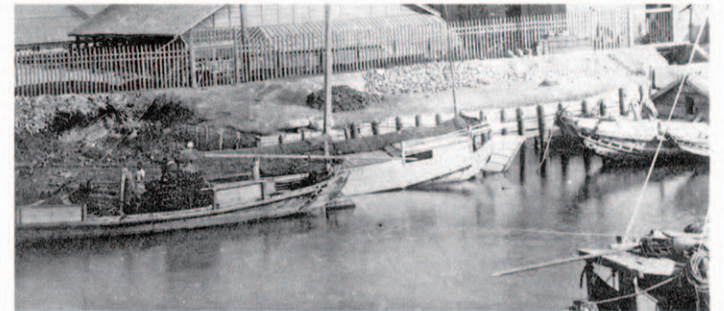
今の白鳥橋付近 板柵護岸に和船 明治24年 (濃尾大震災写真帖)