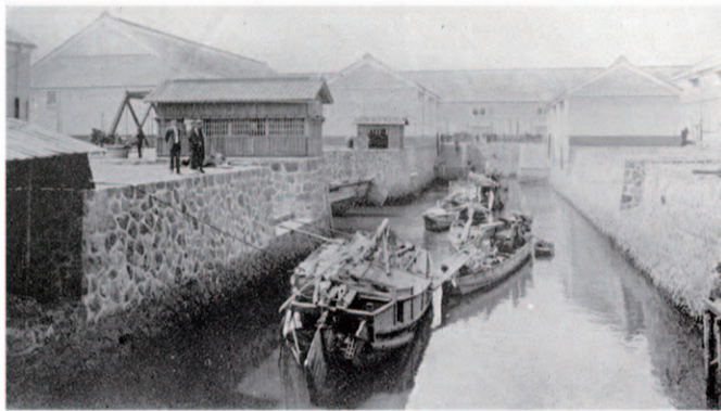
納屋橋下流 混雑を避け堀川からの引き 込み水路で荷役 明治43年 (愛知県写真帖)