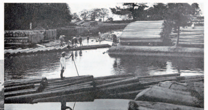
上：白鳥貯木場 大正2年 (愛知県写真帖)