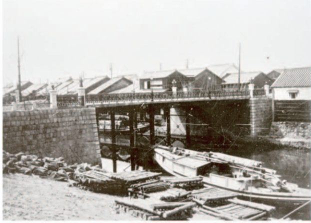
景雲橋 橋はモダンだが舟は和船 大正2年