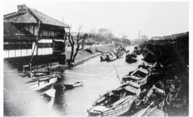
納屋橋から下流 堀川は大混雑 明治40年