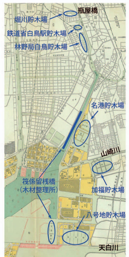
「名古屋港全図」昭和11年に加筆

堀川は、港と貯木場の整備により、大量の木材が集まるようになっていた。水主町から瓶屋橋にかけて製材・製函工場が密集して、川面には丸太が浮かぶ風景が生まれ、堀川は、まさに木材の川という状態になってきた。