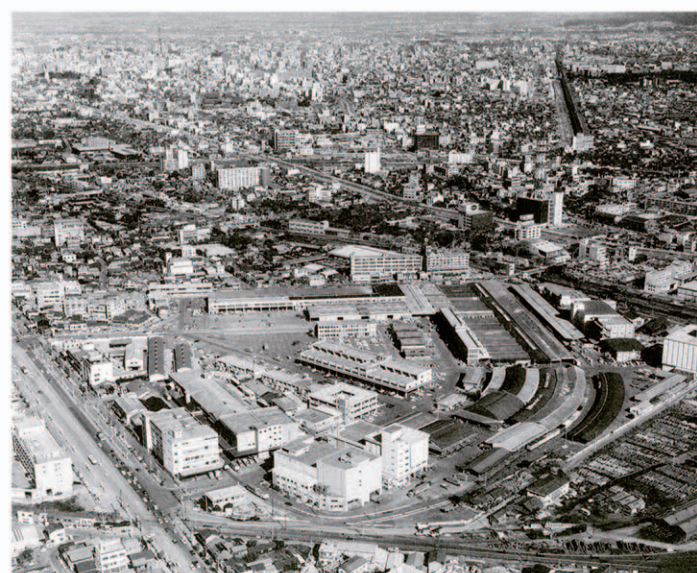
中央卸売市場本場 (名古屋市中央卸売市場50年誌 昭和45年)

熱田の漁業は時代とともに衰退していったが、熱田の魚市場は活発な取引を続け、市内には熱田の他にいくつもの民営魚市場・青物市場が生まれていた。大正7年の米騒動を契機に中央卸売市場法が制定され、翌年名古屋でも計画原案がたてられた。しかし既存の市場関係者からの反対が強く、昭和9年には調査費の追加予算が市会で否決されている。民営から公設市場に変わるきっかけとなったのは、太平洋戦争の物資不足である。昭和16年に物資統制令が出され配給制度が強化されていった。それにより魚・青物市場も荷受と配荷を一元化している。17年になると卸市場予算が市会で可決されて、白鳥貯木場の北に隣接する広い土地に建設される事になった。19年に建設が始まったが、20年の空襲で