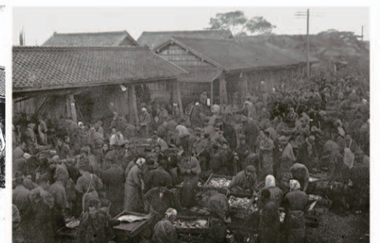
熱田魚市場 (愛知県写真帖 明治43年)

60人が県に陳情に出かけようと血気にはやっているところを町の総代が駆けつけて収めたということもあつた。