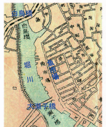
熱田魚市場周辺 (名古屋市実測図 明治43年)

明治になつても熱田の漁業は盛んで、15年には羽城・木ノ免・大瀬子の300戸余りが漁業に従事しており、17年には熱田魚組合が設立され、36年には漁業法に基づく熱田町漁業組合ができている。東海道線が全通したせいだろうか、明治23年刊の『尾張名所図絵』には、「毎朝市を開きで……近年に至りては販路を美濃・飛騨・信濃等の諸国に開き、其市場の盛大なることは全国無比と称せらるるに至れり」と書かれ、全国有数の魚市場に成長していた。