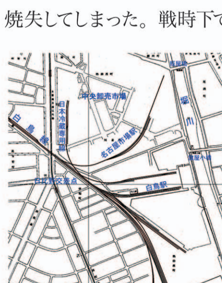
名古屋市場駅と白鳥駅 (国土基本図 昭和45年)

焼失してしまった。戦時下では県食品市場取締規則によって市場を開設していたが、昭和24年に中央卸売市場法による中央卸売市場本場が開業した。取り扱うのは水産物・青果物・漬け物である。32年になると引き込み線が延長されて東海道線名古屋市場駅も設けられ、市場の主要施設は線路に沿って配置された。鉄道により全国各地から荷が運び込まれていたが、トラック輸送の興隆により53年10月1日に駅は廃止されている。