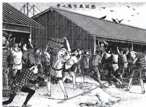
熱田魚市場之景 (尾張名所図絵 明治23年)

明治29年に熱田港(現:名古屋港)の建設が始まり、40年には海外貿易ができる開港場に指定された。大正14年に名古屋港内で漁業をしていた木ノ免町の漁師が違法操業という事で逮捕された。港内での漁業が完全に禁止されては熱田と下之一色の漁師500人の死活問題だと、