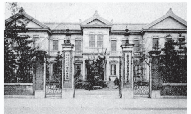
武平町（現・東区泉1）にあった帝室林野管理局名古屋支庁（愛知県写真帖 明治43年）

木曾御料林の木材は明治44年の中央線開通により鉄道輸送が始まった。大正5年には臨港線の支線で白鳥貯木場と名古屋駅を結ぶ白鳥線が完成し、木材専用の白鳥駅が営業を開始した。開設に合わせて、貨車から降ろした木材を貯木し筏に編成する白鳥駅貯木場が、鉄道省により駅に隣接して設けられている。翌年から白鳥貯木場の大改修が始まった。白鳥駅から貯木池への引き込み線が引かれ、貯木池も改修されて、10年に拡張事業が完成している。46,900坪（15.5ha）という広大な貯木場で、12年には水上移動式クレーンを設置して揚陸作業の効率化も行っている。