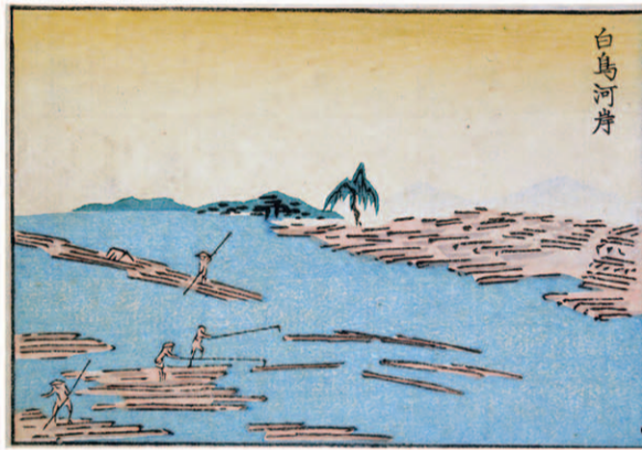
白鳥河岸（名区小景）