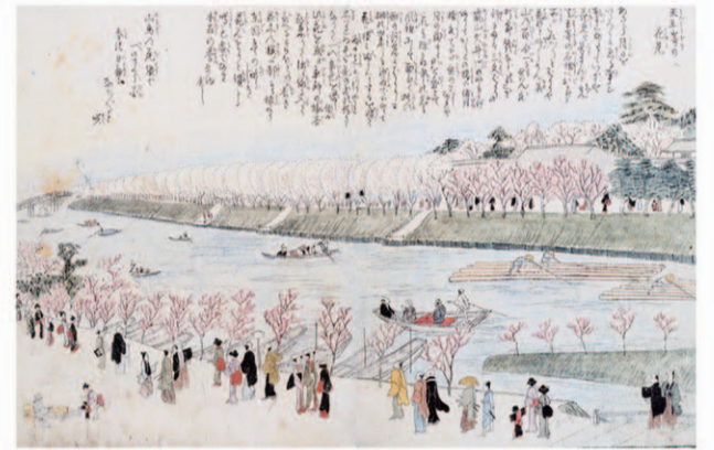
天王崎をゆく筏（桜見与春之日置）

明治になって尾張藩有林は官有林に組み込まれ、22年からは御料林（皇室財産）となったが、それまでと同様に筏輸送により白鳥貯木場へ運ばれていた。入荷量の増加と将来は筏から鉄道輸送へ変わることを想定して、明治40年に隣接の土地17,600坪（5.8ha）を買収している。