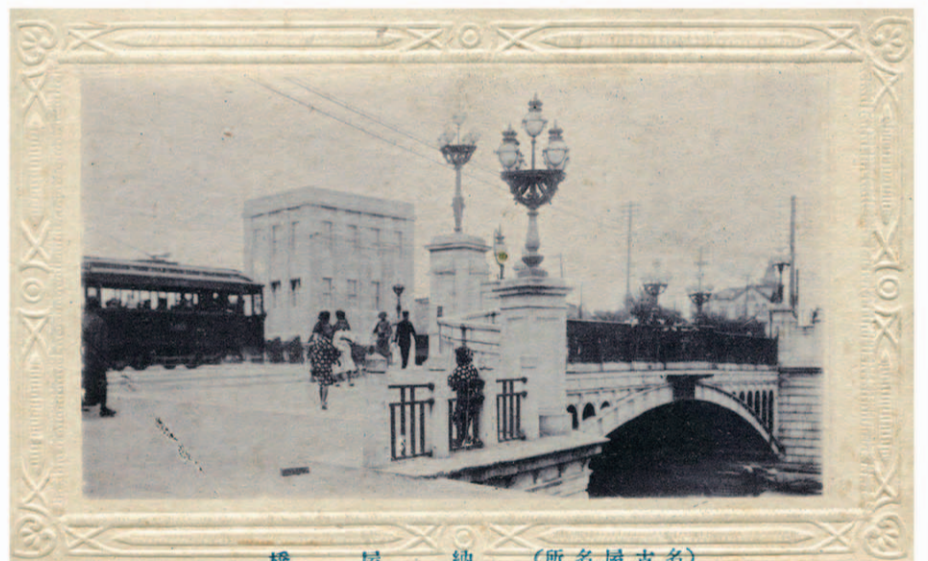
橋屋納 (所名屋古名) 中央の建物は加藤商会ビルの旧建物(煉瓦建築) 橋の南西から撮影