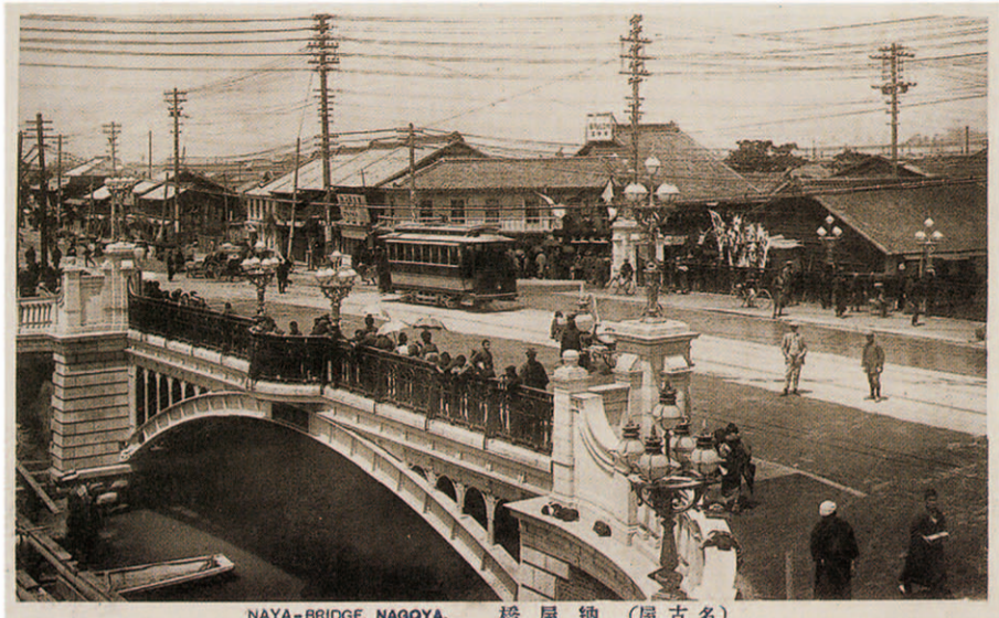
NAYA-BRIDGE, NAGOYA. 橋屋納 (屋古名) 中央の建物は、納屋橋まんじゅう 橋の南東から撮影