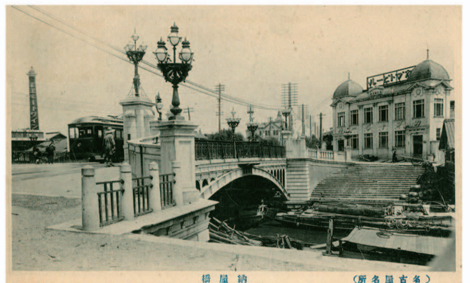
橋屋納 (所名屋古名) 堀川には舟。橋のたもとには物揚場があり、水陸交通の接点 橋の南西から撮影