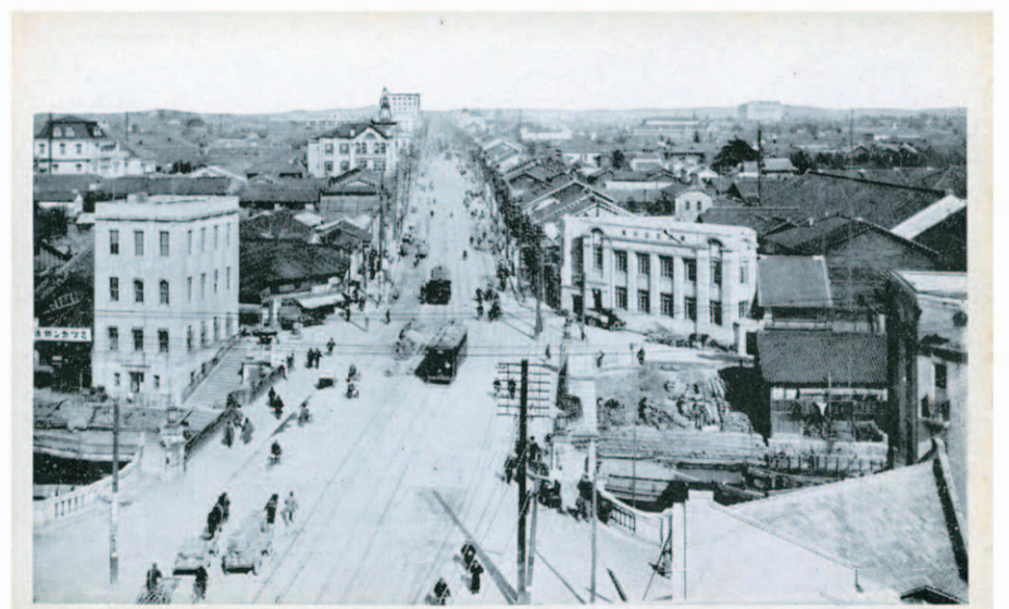
NAYABASHIFUKIN (Nagoya) 近附橋屋納 (所名屋古名) 大正7年の米騒動で鈴蘭灯が壊され、違うものが付いている 橋の西から撮影