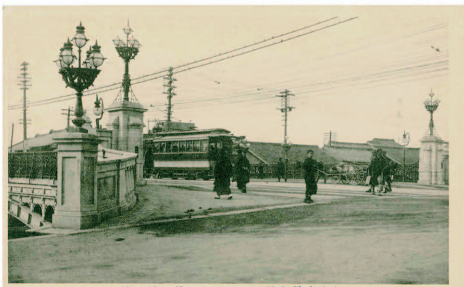
橋屋納 (所名屋古名) 向こう側を馬車がゆく 橋の南東から撮影

大正2年に納屋橋は重厚な鉄石混用のアーチ橋に架け替えられた。納屋橋まんじゅうと長命うどんの三世代夫婦が渡り初めを行い、橋の完成を祝っている。