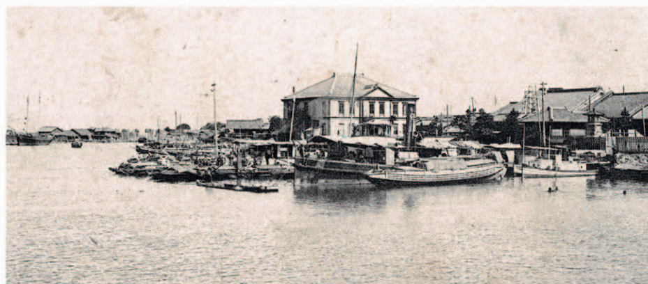
明治後期の熱田……蒸気船が接岸している