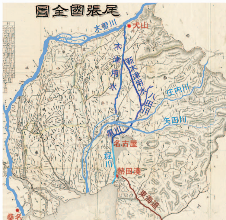
『尾張国全図』 明治12年

とに元杵樋門を設けて南に向けて水路を掘り、三階橋の北で川村（現：守山区）から流れてくる御用水と合流。矢田川は伏越で川底をくぐり南岸の辻村（現：北区）へ出る。ここで堀川と結ぶ新しい水路（黒川）と御用水や庄内用水などを分流させる。堀川へは、御用水に沿って南西に向かう新しい水路を掘り、今の猿投橋のところまで従来から堀川に流れ込んでいた大幸川に接続。それより下流は大幸川を改修した。工事は10年10月に完成し、総工費は3万9千円であった。