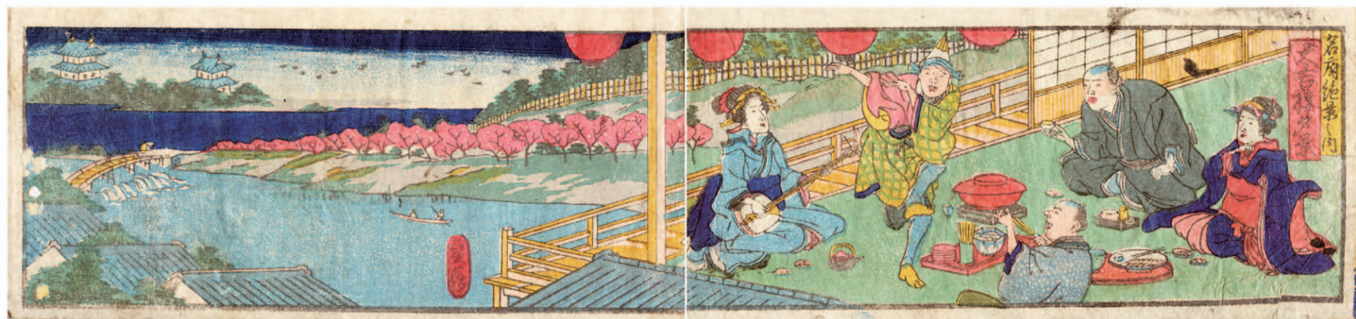
大吉楼の楼上で憩いのひととき 『名婦之里』

とりわけ有名なのが今の小塩橋西付近にあった料亭「大吉楼」。『名婦之里』に「名府絶景の内 大吉楼夕景」として紹介されている。金鯢輝く城を左手に、下には「ごーごー橋」と呼ばれた朝日橋が描かれ、堀川対岸に今を盛りと咲き誇る桜並木。大吉楼上ではお大尽が春爛漫の夕景色を肴に一杯きこしめしている。